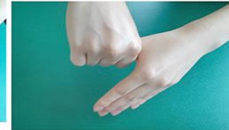
⑤親指を握るようにはすり込む