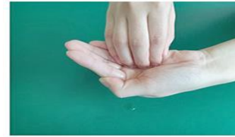
①手のひらにアルコールをためて、指先を覆す