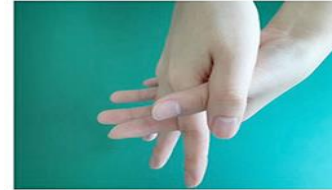
④指を組合せ、指の間にすり込む