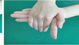
②手のひらにすり込む、