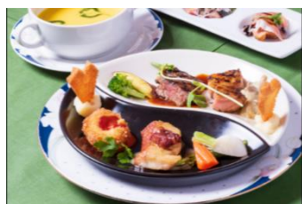
ある日のランチメニュー の一部

ホテルオークラ出身のオーナーシェフの作るフレンチは絶品なのにリーズナブル！予約必須です。