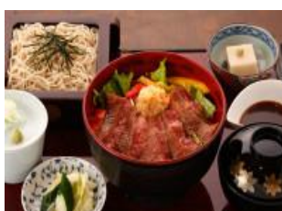
「足柄牛の小田原丼」 レア目に焼き上げたお肉は絶品！