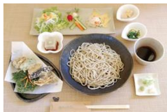
手打ち蕎麦も自家栽培 全て一つ一つ手造り