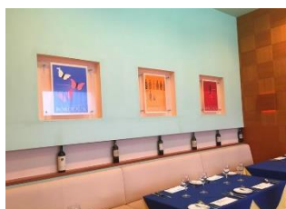
オシャレな雰囲気の店内で お食事をお楽しみいただけます