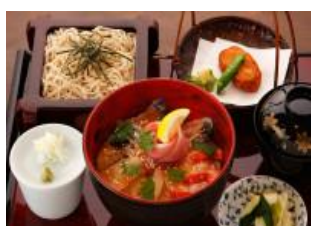
「海の小田原丼」 新鮮な魚介類の ゴマ醤油漬丼