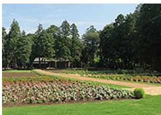
お店の前に広がる田園風景 こちらの畑から毎朝シェフが 野菜を収穫します